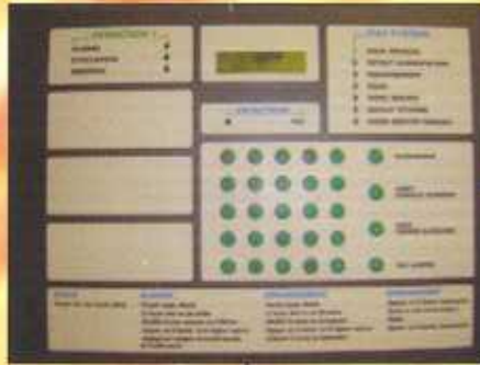
Tableau de Signalisation